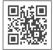
「コロナワクチンナビ」 二次元コード