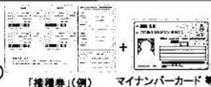
「接種券」(例) マイナンバーカード等

※ 接種前にご自宅で体温を測定し、明らかな発熱がある場合や体調が悪い場合などは、接種を控え、予約した市町村の窓口や医療機関にご連絡ください。