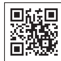
「コロナワクチンナビ」 二次元コード