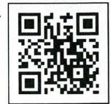
「コロナワクチンナビ」 二次元コード

「コロナワクチンナビ」サイトアドレス: https://v-sys.mhlw.go.jp