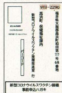
事前申込ハガキイメージ

④ 指定の日時になりましたら、接種券、予診票等をお持ちになり、集団接種会場(中央体育館)で接種してください。