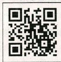
「コロナワクチンナビ」 二次元コード