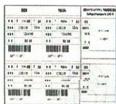
接種券 (クーポン券)