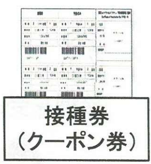
接種券 (クーポン券)