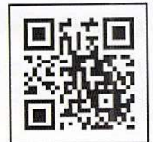
「コロナワクチンナビ」 二次元コード