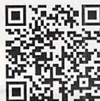
広野町予約専用サイト 二次元コード

https://www.town.hirono.fukushima.jp/kenkoufukushi/covid19_vaccine.html