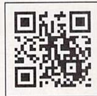
コロナワクチンナビ 二次元コード